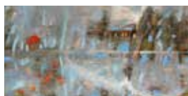
FABIOSALAFIA Geografie del cuore