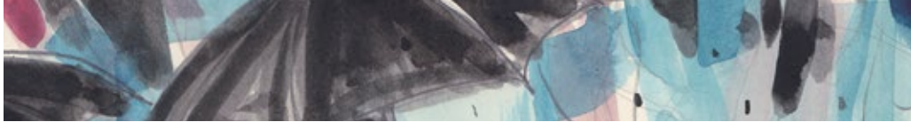
DFFF L'isola come set